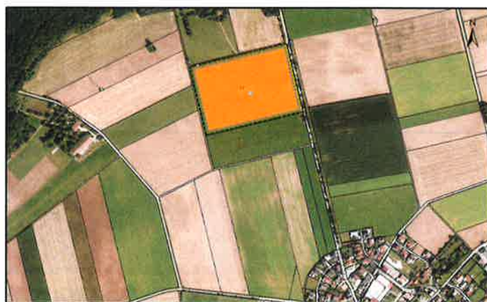
Luftbild (Geltungsbereich in orange)