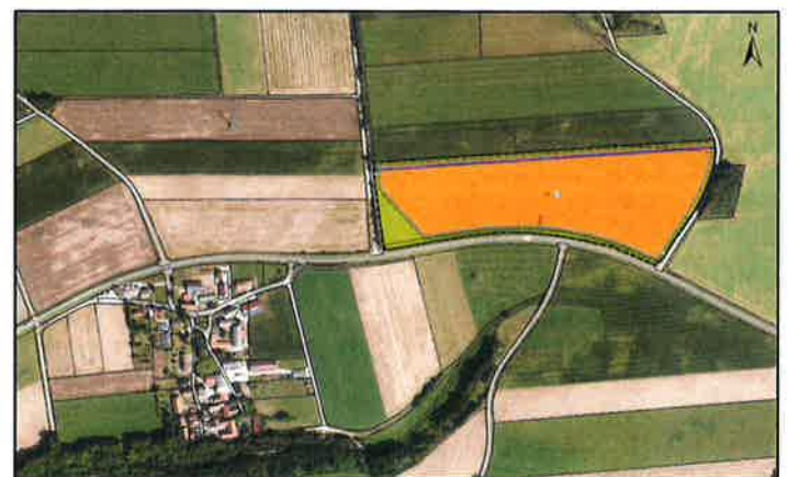
Luftbild (Geltungsbereich in orange)