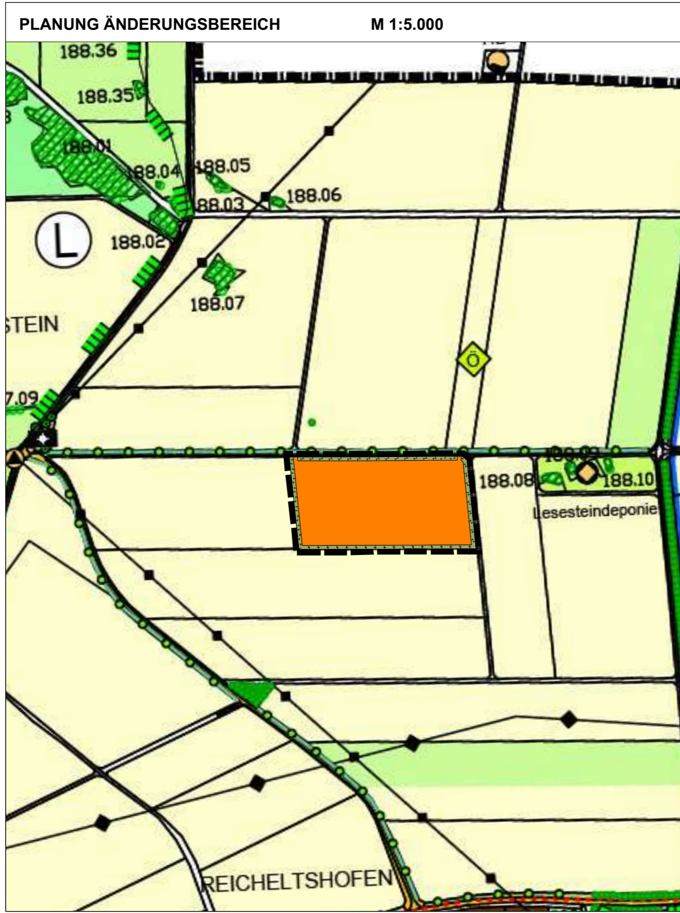
Kartengrundlage: Flächennutzungsplan (Scan)