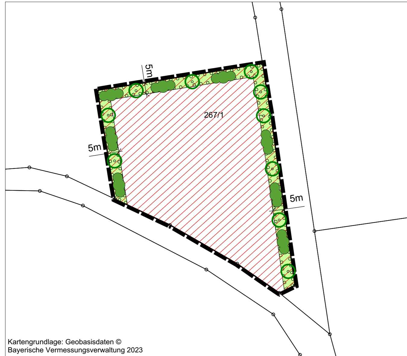
Kartengrundlage: Geobasisdaten © Bayerische Vermessungsverwaltung 2023