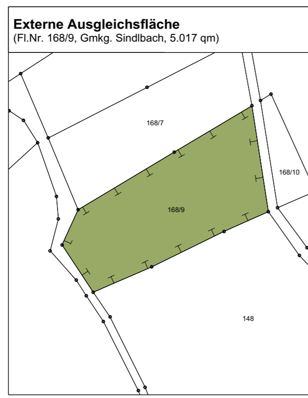
Externe Ausgleichsfläche (Fl.Nr. 168/9, Gmkg. Sindlbach, 5.017 qm)

Aufgrund von § 34 Abs. 4 Satz 1 Nr. 3 des Baugesetzbuches (BauGB) erlässt die Gemeinde Berg bei Neumarkt i. d. OPf. folgende Satzung: