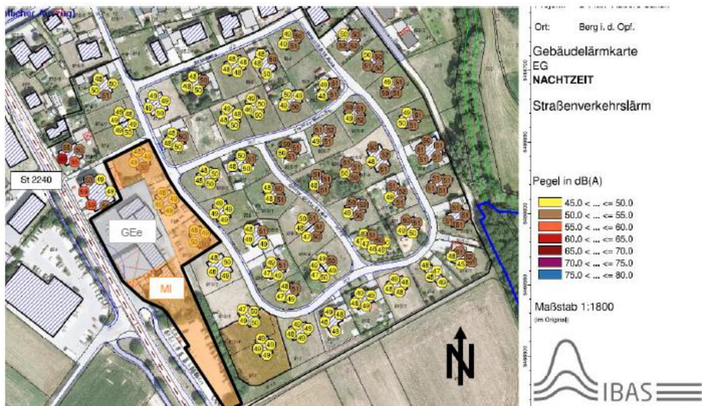
Abbildung 3 - Auszug aus Anhang 3.2 der schalltechnischen Untersuchung der IBAS Ingenieurgesellschaft mbH vom 30.01.2023 (Bericht-Nr. 21.12991-b01) inkl. Markierung des Plangebiets

Zur Gewährleistung eines ausreichenden Schallschutzes für die geplanten und bestehenden Gebäude wurden die maßgeblichen Außenlärmpegel gem. DIN 4109 „Schallschutz im Hochbau“ ausgewiesen. Diese bilden die Grundlage für die Planung und Dimensionierung passiver Schallschutzmaßnahmen an Fenstern und Fassaden.