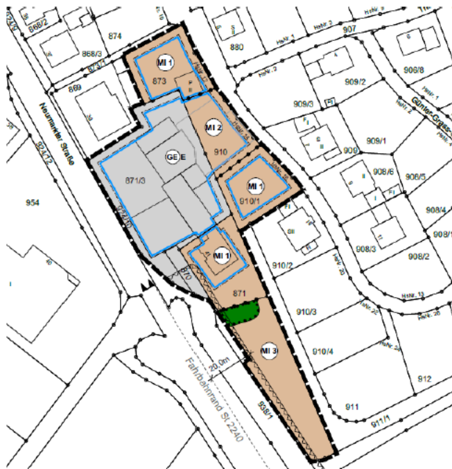
Abbildung 1 – Lageplan

Die Gemeinde Berg b. Neumarkt i.d.OPf. plant die 3. Änderung des Bebauungsplans „Äußere Sandn“. Der Änderungsbereich umfasst die Grundstücke mit Fl.-Nrn. 870, 871, 871/3, 873, 910 sowie 910/1 der Gemarkung Berg. Ziel der Änderung ist die teilweise Ausweisung von Flächen als Gewerbegebiet gemäß § 8 BauNVO sowie als Mischgebiet nach § 6 BauNVO. Der Geltungsbereich befindet sich im westlichen Teil des bestehenden Baugebiets „Äußere Sandn“ zwischen der „Neumarkter Straße“ im Osten und dem Heinrich-Böll-Ring im Westen. Der Bebauungsplan „Äußere Sandn“ trat am 23.08.1994 in Kraft und erfuhr durch die Deckblätter 1 und 2 seine entsprechenden Änderungen.