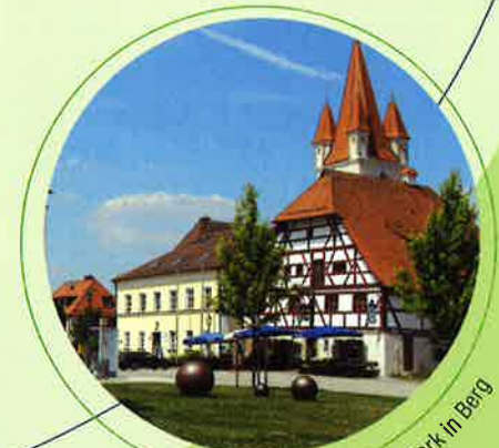
Rathaus und Sophie-Scholl-Park in Berg

Beim Busfahrer erhalten Sie alle in der Tabelle genannten Fahrkarten. Bitte quittieren Sie nach Ihrer Fahrt das vom Busfahrer überreichte Formblatt.