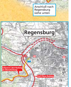
Fortsetzung Schwarze Laber-Radweg nach Regensburg

Wallfahrersweg (Wanderweg gesamt 130 km / von Breitenbrunn über Plankstetten, Eichstätt nach Wemding) Von Breitenbrunn bis Eichstätt / Wemding im Naturpark Altmühltal führt der Wallfahrersweg an zahlreichen sehenswerten Kirchen und Klöstern vorbei (Infoblatt beim Naturpark Altmühltal vorhanden).