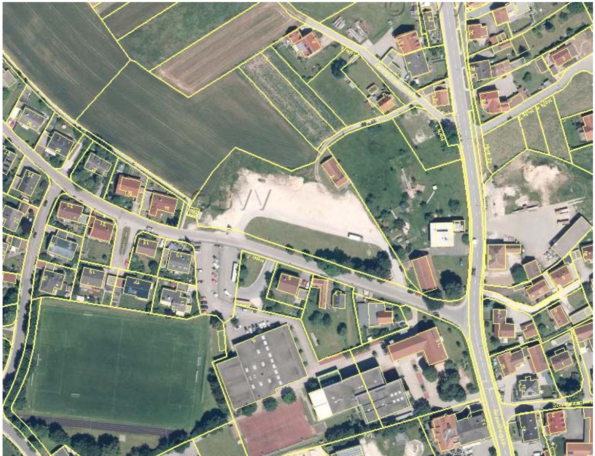
Luftbildkarte des Planungsgebiets