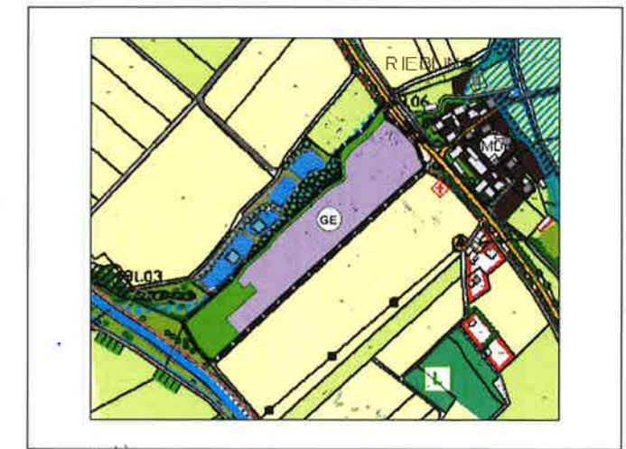
Flächennutzungsplanänderung (schwarz gestrichelte Linie - Grenze Änderungsbereich)