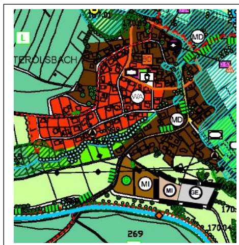
Flächennutzungsplanänderung (schwarz gestrichelte Linie - Grenze Änderungsbereich)